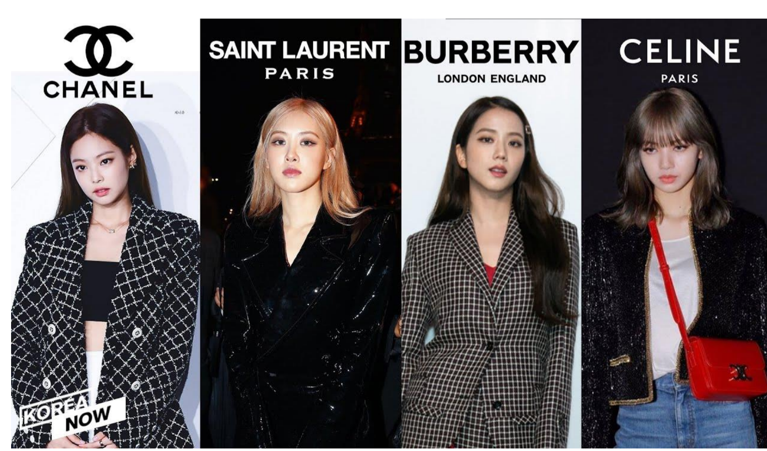
Рисунок 4 – Участницы команды BLACKPINK – лица мировых брендов

Основной причиной влияния К-рор культуры на современную экономику является то, что корейская культура активно работает с аудиторией, воздействуя на нее разными способами: во-первых, она охватывает множество стилей (элементы техно, диско, хип-хопа, R&B, рэпа, рока и электро); во-вторых, происходит распространение творчества не только на корейском языке (английский, китайский, немецкий и т.д.); в-третьих, к-рор культура – явление массовой культуры, что подтверждается развлекательным характером, использованием спецэффектов, запоминающихся мелодий и текстов, сопровождающихся синхронными движениями, яркими костюмами, динамичными постановками. Но каковы же последствия этого влияния? Для того, чтобы это выяснить мы провели исследование в формате интервью с представителями современной молодёжи. В качестве интервьюеров выступили 5 подростков в возрасте от 13 до 17 лет, которым было предложено ответить на следующие вопросы: