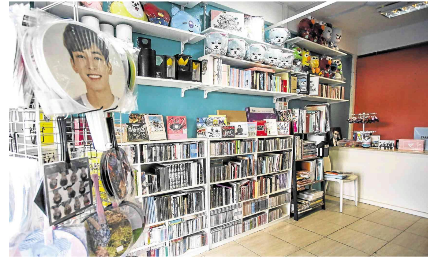
Рисунок 2 – Продажа товаров